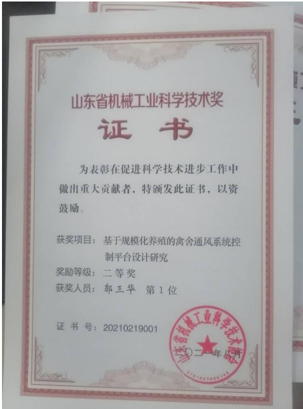
山东省机械工业科技进步奖