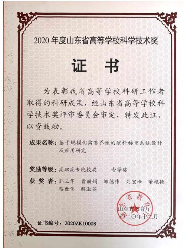
2020年山东省高等学校科学技术奖一等奖